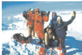
Auch im Winter

Unser 'Soft-Outdoor' lebt von der differenzierten Reflexion und dem gezielten Transfer in den Arbeitsalltag. 1-3 Tage erhöhen die Effektivität Ihrer Zusammenarbeit.